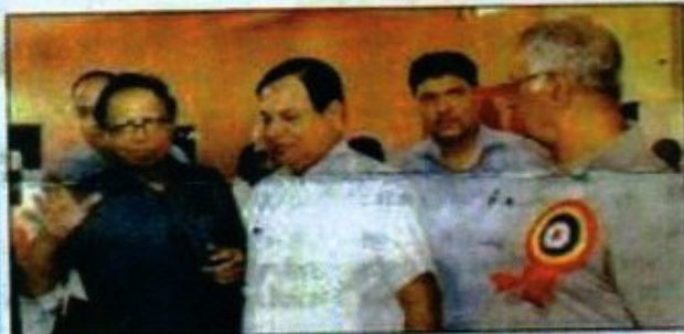
कोरिंथी नगर (संवाददाता)।

भारतीय कार्यकर्ता सहकारी समिति की वार्षिक आम सभा 2 अक्टूबर को कोरिंथी नगर स्पोर्ट्स कॉम्प्लेक्स में सम्पन्न हुई। समिति के 2000 से अधिक सदस्य हैं। इस अवसर पर निःशुल्क स्वास्थ्य जांच एवं रक्तदान शिविर का आयोजन भी किया गया जिसमें जादू कला टुस्ट एवं शत्रुित्र सुखरायण बिरादरी ने भी सहयोग दिया। चर्चिष्ठ डॉक्टरों की टीम का लखनऊ हॉस्पिटल के डॉक्टर अरुण. कालरा